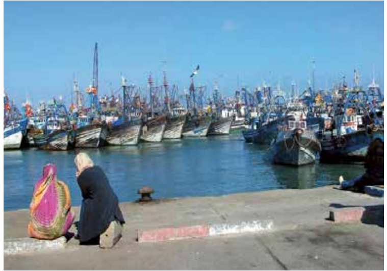
Port de Dakhla.

Au cours de l'été, les réfugiés sahraouis n'ont pas seulement continué à être victimes de l'incapacité programmée des organisation internationales mais aussi des éléments naturels..