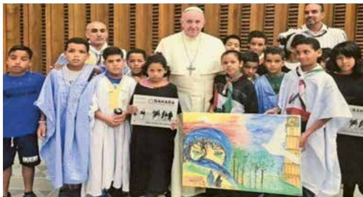
Le pape François a reçu des enfants sahraouis au Vatican.