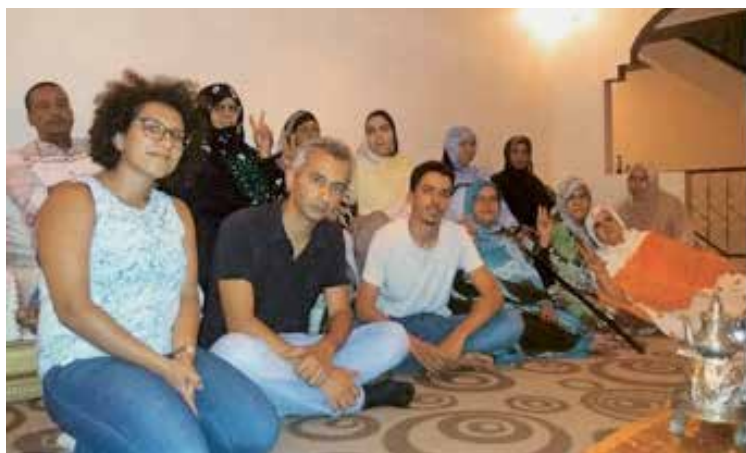
Des familles des prisonniers sahraouis rencontrent l'ONG Human Rights Watch.

Human Rights Watch, avec les informations de première main