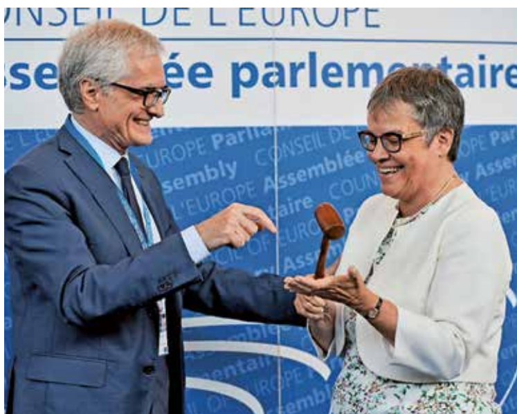
Michele Nicoletti passe le témoin à la nouvelle présidente de l'APCE, Liliane Maury Pasquier.

La conseillère aux Etats Li- liane Maury-Pasquier, siégeant au Conseil de l'Europe, a été élue en juin 2018 présidente de l'APCE. On se souvient que c'est elle qui a lancé en 2011 la résolution « contribution par- lementaire à la résolution du conflit du Sahara Occidental » à Strasbourg, au moment où le Maroc demandait à deve- nir le premier partenaire pour la démocratie de l'APCE. Une fois la résolution votée, Liliane Maury Pasquier a été nommée rapporteuse. Pour documenter son rapport, elle s'est rendue dans les camps de réfugiés sahraouis, au Sahara Occiden- tal où elle a exigé du Maroc de pouvoir rencontrer librement des associations sahraouies, ainsi qu'au Maroc. La situation du peuple sahraoui a ainsi été rendue visible au Conseil de l'Europe grâce à son travail de fond. Pour la première fois, une résolution comme il n'y en avait